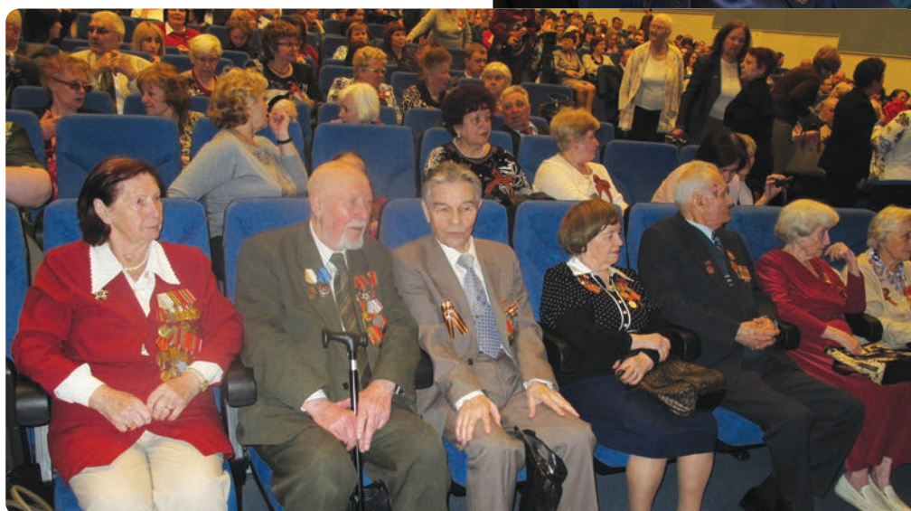
Собрание членов Совета пенсионеров-ветеранов войны и труда ОАО «НК «Роснефть»