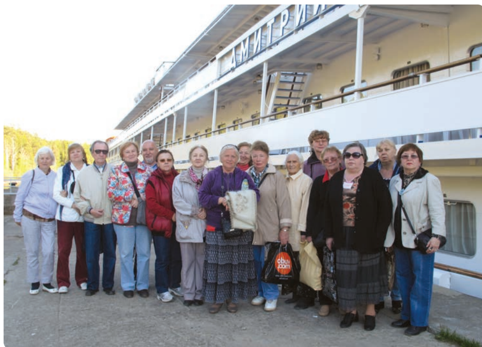
Пароходный круиз по Волге