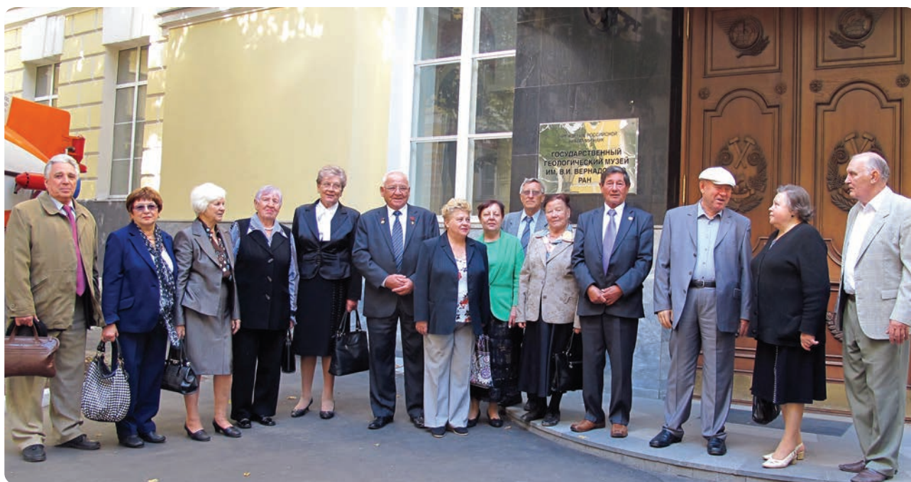
Перед Государственным геологическим музеем, г. Москвы