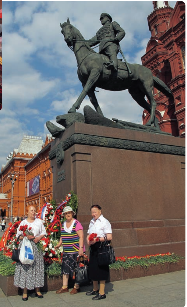
У памятника Г.К. Жукову