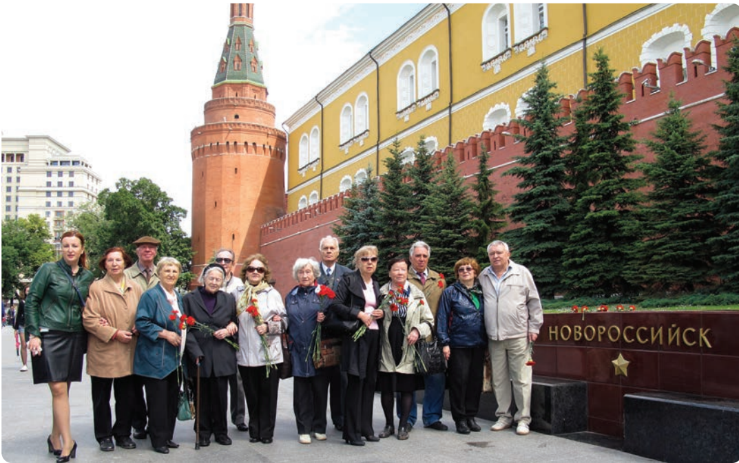
У стен Кремля