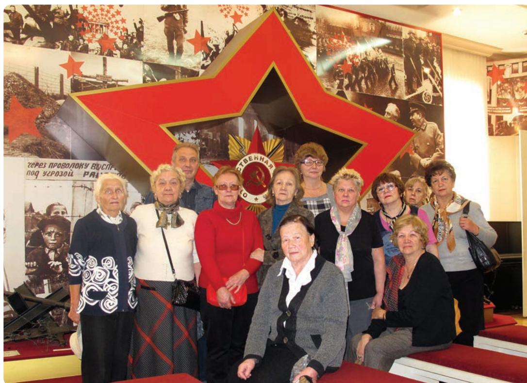
В музее ОАО «НК «Роснефть»