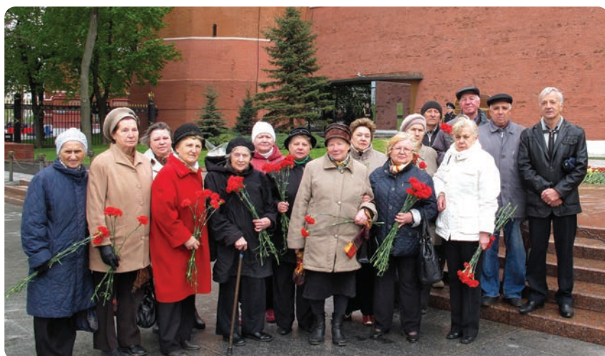
У памятника Неизвестному солдату