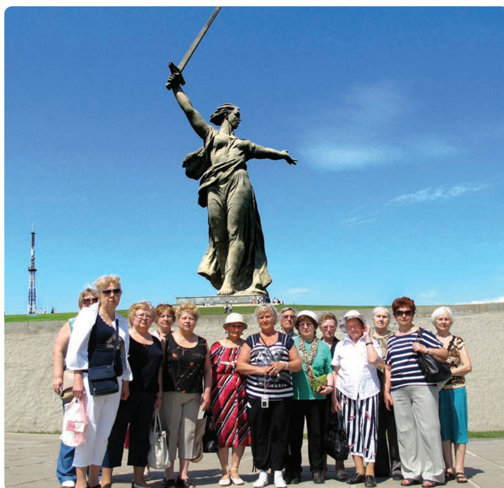
На Мамаевом кургане