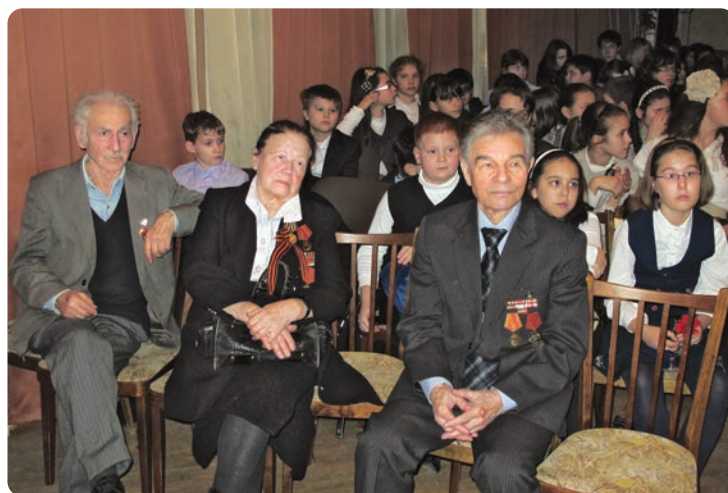
Фронтвики «Роснефти» в школе № 1262