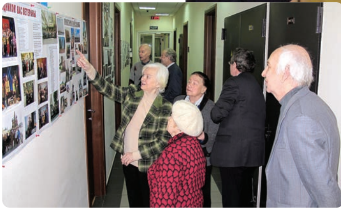
Стенгазеты Совета ветеранов