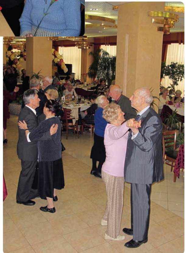
На торжественном вечере