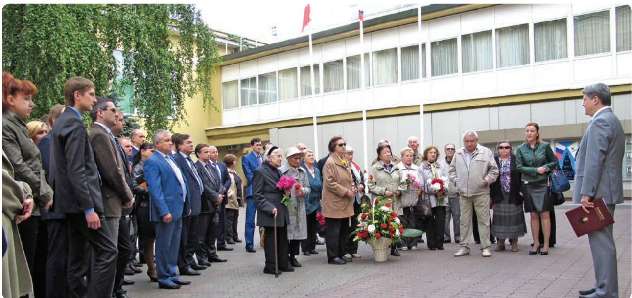
Митинг, посвященный памяти погибших в Великую Отечественную войну нефтяников